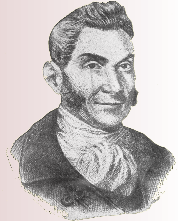
DON BARTOLOMÉ JOSÉ GALLARDO (1776-1852)